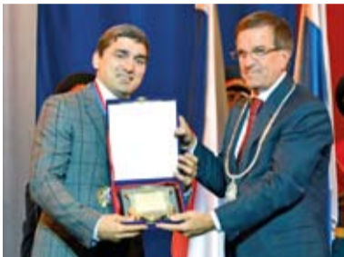
ВАРТЕРЕС САМУРГАШЕВ СТАЛ ПОЧЕТНЫМ ГРАЖДАНИНОМ РОСТОВА-НА-ДОНУ