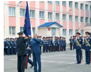
ЗНАМЯ ПРЕЗИДЕНТА РОССИИ ВЕРНУЛОСЬ НА ДОН