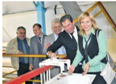
ФРАКЦИЯ «ЕДИНАЯ РОССИЯ» ПРОВЕЛА ВЫЕЗДНОЕ СОБРАНИЕ НА ОБЪЕКТАХ «РОСТОВ- ВОДОКАНАЛА»